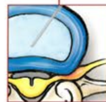
Platzieren der Zugangskanüle cervical.