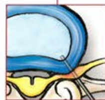
Platzieren der Zugangskanüle lumbal.