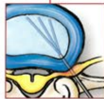
Dekompression: Die patentierte Elektrode wird durch die Kanüle in den Bandscheibenkern eingeführt und entfernt überschüssiges Gewebe.